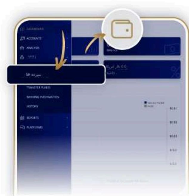
3. بر روی DEPOSITS کلیک کنید

نام کاربری که برای ثبت نام استفاده کردید و رمز عبوری که هنگام باز کردن حساب خود ایجاد کردید را تایپ کنید