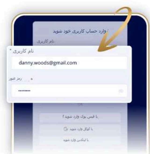
2. از اعتبار خود استفاده کنید

با ورود به پورتال مشتری خود به تجارت My دسترسی پیدا کنید fortune-inheritance.com