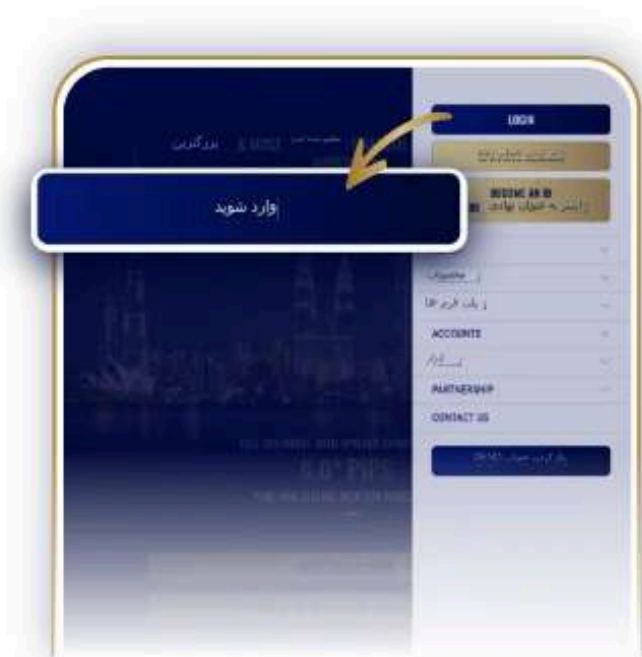
1. وارد شوید

می توانید از روند گام به گام زیر برای راهنمایی شما در مورد نحوه واریز وجوه در حساب معاملاتی خود استفاده کنید.