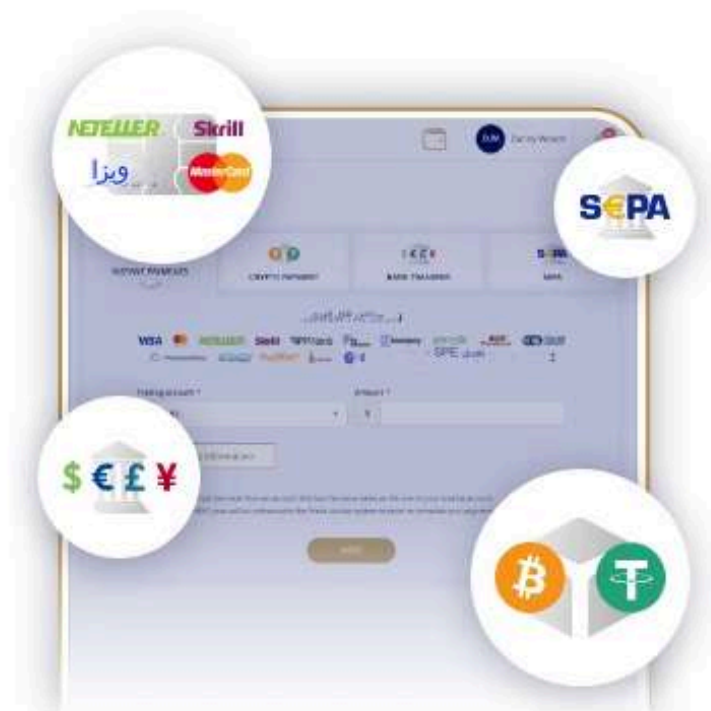
4. روش پرداخت را انتخاب کنید

در میان دسته های بودجه مرور کنید و روی روش پرداخت دلخواه خود کلیک کنید.